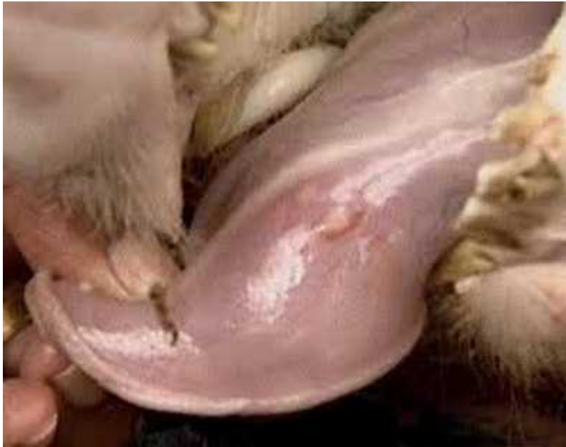
Lava wakiwa chini ya ulimi wa nguruwe