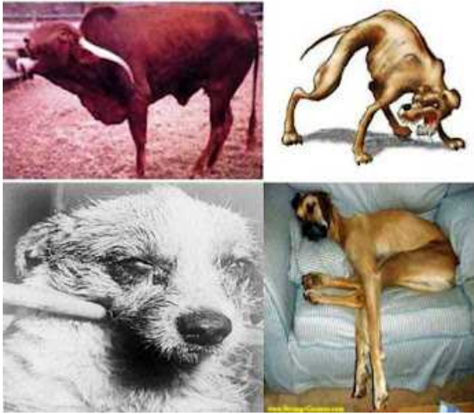
Dalili za wanyama waliopooza