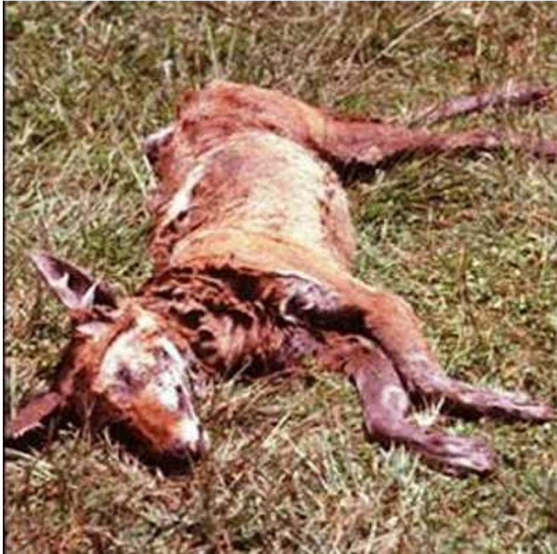
Mnyama aliyekufa kwa kichaa cha mbwa