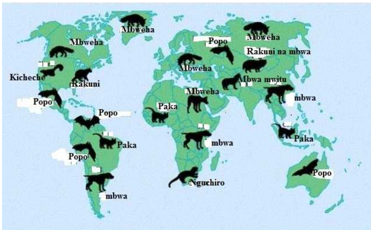
Ramani ya dunia kuonyesha aina ya wanyama wanaoeneza kichaa cha mbwa kwa kila nchi

Msambazaji mkuu wa ugonjwa wa kicha cha umbwa ni mbwa (jina la ugonjwa latoka hapa) na wa pili ni paka. Wanyama wengine kama popo pia wanauwezo wa kusambaza ugonjwa huu kwa mwanadamu na kwa wanyama wengine hasa maeneo ambayo usambazi kwa njia ya mbwa na paka imezibitiwa. Wanyama wengi wa porini (kama wanavyoonekana kwenye ramani ya dunia hapa chini) ni watunzaji wakubwa wa virusi vya ugonjwa huu na wanauwezo wa kuusambaza pia kwa wanyama wengine.