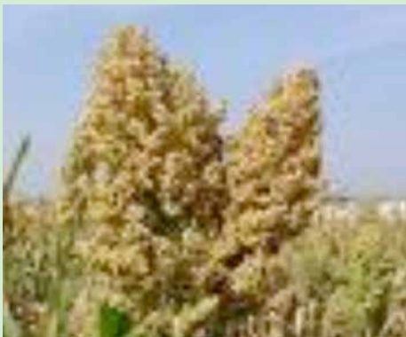
Mtama aina tofauti

Mchanganyiko sahihi wa viini lishe kwa mahitaji ya kifaranga, humwezesha kukarabati na kujenga mwili (kukua) haraka. Viini lishe tulivyovitaja hapa juu hupatikana katika aina mbali mbali za viungo ghafi vya chakula cha kuku kama ifuatavyo: