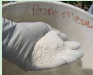
Unga wa Mifupa