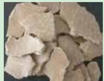
Mashudu ya karanga