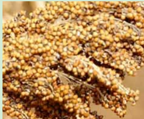
Mtama aina tofauti